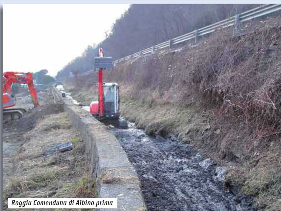
Roggia Comenduna di Albino prima

Ecco alcune immagini dell'attività di pulizia delle rogge del Consorzio: a sinistra rispettivamente la roggia Comenduna di Albino e la roggia Morlana di Nembro prima della pulizia. A destra le stesse rogge dopo il trattamento. Sotto pubblichiamo il programma delle asciutte per permettere la pulizia dei corsi d'acqua