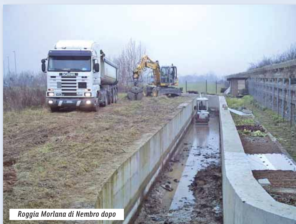
Roggia Morlana di Nembro dopo