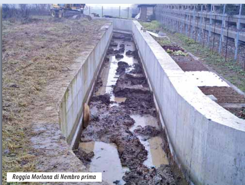
Roggia Morlana di Nembro prima