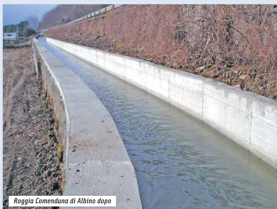
Roggia Comenduna di Albino dopo