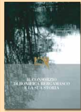
La copertina del libro sulla storia del Consorzio

Per celebrare degnamente i primi cinquant'anni del Consorzio di Bonifica della Media Pianura Bergamasca le iniziative organizzate sono state diverse: una mostra fotografica itinerante che ha toccato diversi paesi, un libro e uno stand alla fiera campionaria. L'ente ha scelto di mettere alla comunicazione con cittadini e utenti per coinvolgerli nella sua attività e far meglio comprendere il ruolo che il Consorzio riveste per la salvaguardia delle risorse idriche. Durante la fiera campionaria nell'ottobre scorso il Consorzio ha allestito uno stand con fotografie e testi divulgativi per diffondere informazioni