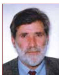
Unione di cittadini, agricoltori, industriali e proprietari di case