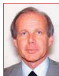
Unione di cittadini, agricoltori, industriali e proprietari di case