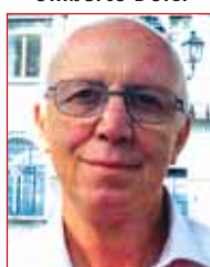
Cittadini e Consumatori