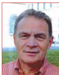
Cittadini e Consumatori