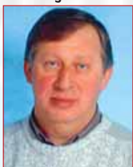
Vicepresidente Acqua Amica