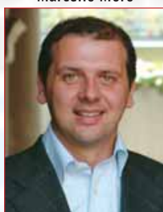
Presidente Acqua e Territorio