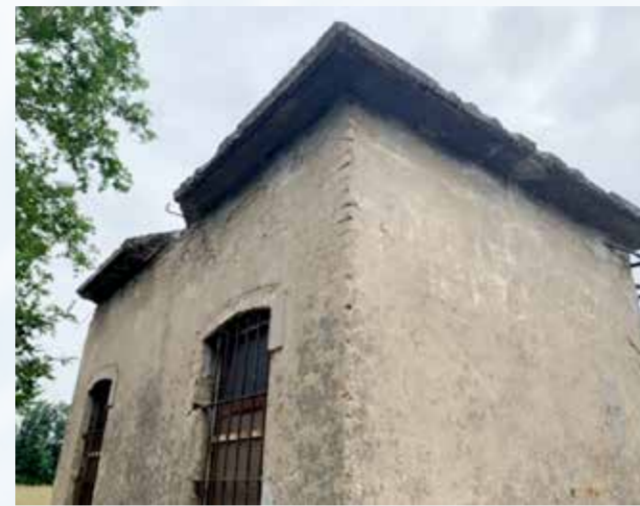
Nelle foto pozzi in Comune di Caravaggio oggetto di intervento

pompa al fine di regolarne il funzionamento, nei quadri di nuova installazione l'inverter sarà inserito già in fase di realizzazione del quadro.