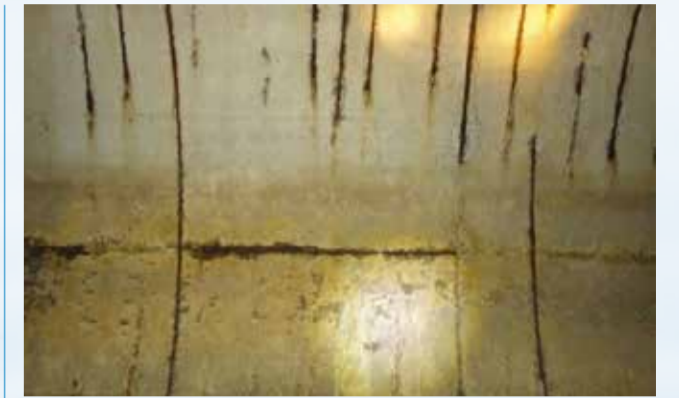
Canale Adda - tratti oggetto di intervento

La realizzazione degli interventi previsti consentirà di rendere più efficiente ed efficace la gestione della risorsa irrigua distribuita attraverso il ripristino della tenuta idraulica del canale e l'impermeabilizzazione dello stesso per garantire la riduzione delle perdite d'acqua in considerazione del manifestarsi sempre più frequente di periodi siccitosi e di scarsità della risorsa irrigua. In sintesi con il presente intervento verranno demolite le parti ammalorate, sigillate crepe e fessu-