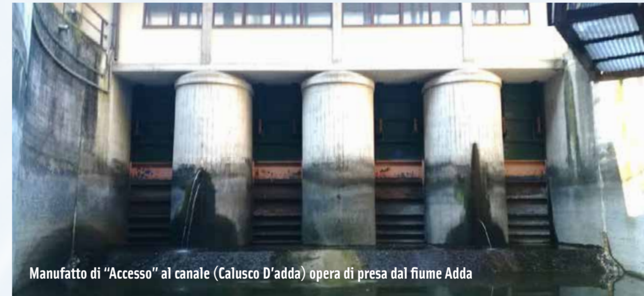
Manufatto di "Accesso" al canale (Calusco D'adda) opera di presa dal fiume Adda

Durante le fasi di scarifica e demolizione saranno attuate procedure per minimizzare le dispersioni di polveri e materiali nell'ambiente.